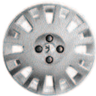
Embellecedor Sketch 15"