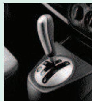
Caja de velocidad pilotada con 5 marchas

Se caracteriza por una automatización del embrague y ofrece dos modos de funcionamiento: manual (cambio de marchas mediante impulsos en la palanca) o automático (el sistema introduce la marcha mejor adaptada al contexto de utilización). La caja de cambios pilotada de Bipper Tepee, disponible con la motorización HDi 75 CV, aporta a la vez confort de conducción, ahorros de consumo y de emisiones contaminantes gracias, especialmente, al sistema Stop & Start.