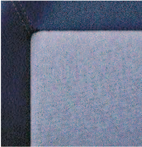
Guarnecido Eklass (Disponible en el nivel Access)