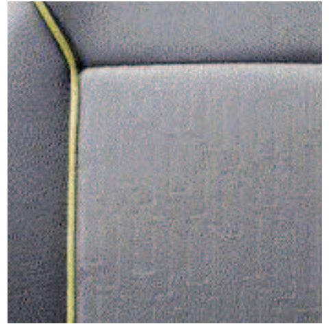
Guarnecido Trip (Disponible en el nivel Outdoor)