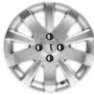
Rueda de aluminio Oranis

*De serie o como opción, según las versiones.